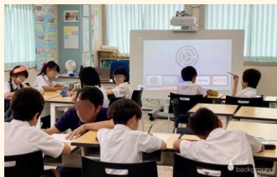
江村が導入校を訪問

文化観光都市・京都で学び、社会に出るうえで世界中の約5,600校で導入され、国際的に通用する大学入学資格が得られる 国際教育プログラム を取り入れるよう提言しています。