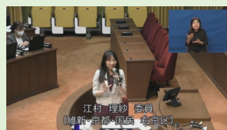
江村 理紗 議員 (維新・京都・国民・東京区)